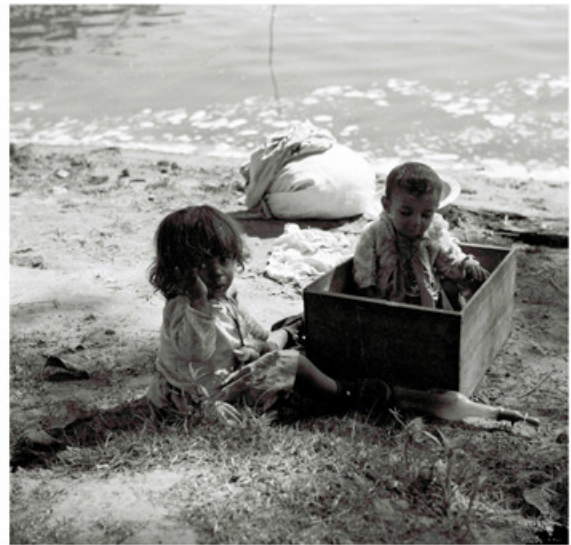
Rio Paranapanema, Porto Alvim, 06/07/1959.