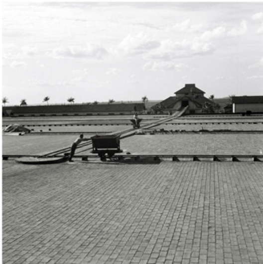
Imagem 4 – Fotos de Armínio Kaiser. Fonte: Arquivo pessoal do fotógrafo.