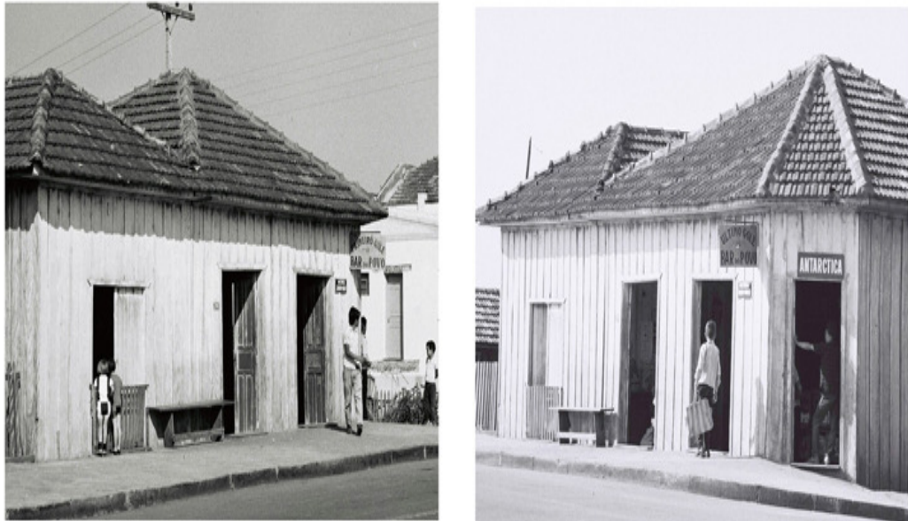
Imagem 2 – Astorga, Paraná, 25/09/1969.